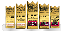
Zahlreiche Auszeichnungen krönen die Qualität unserer Megasat-Produkte

Zugriff auf viele Mediatheken und Videoportale