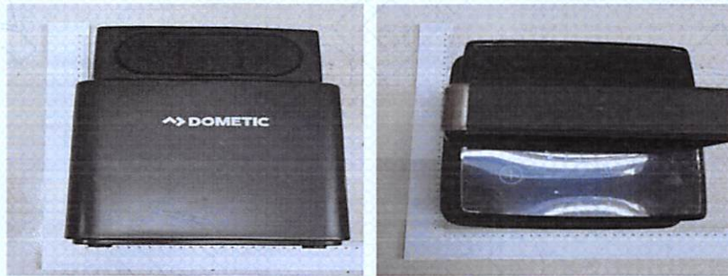
样品图片 Sample Picture